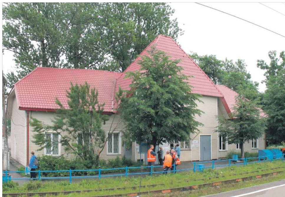
Станция Токсово участвует в пилотном проекте «вокзальных смотрителей»