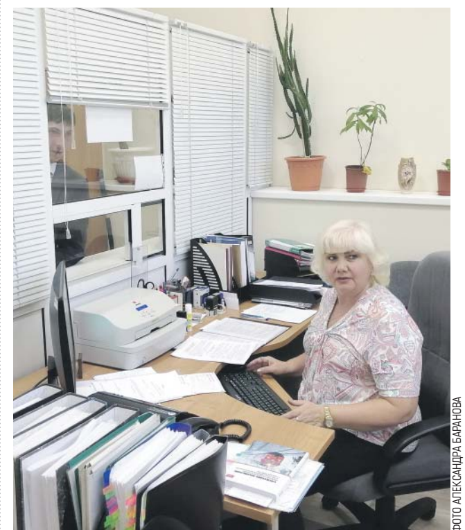
Этим летом стены кабинета, где расположен сектор служебных билетов, должны утеплить