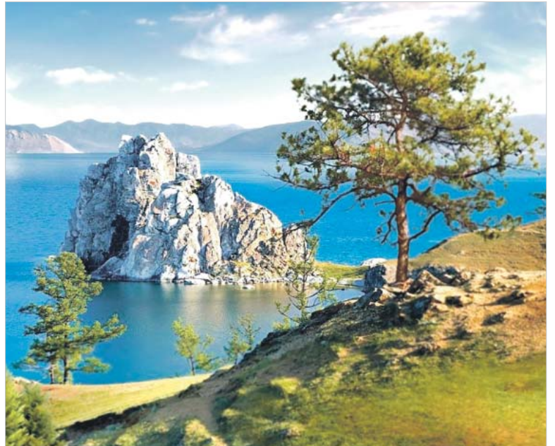
Студенты будут отдыхать не только на берегу Черного моря, но и Японского, а также на берегу Байкала

Студенты этих вузов смогут побывать в Крыму, в пансионате «Волна» в Алуште. Учащиеся Омского и Сибирского уни-