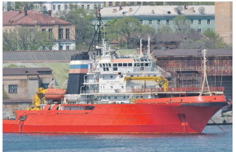
Служащие ТОФ создали прецедент

Это было связано с механизмом формирования их зарплаты: как и у железнодорожников, она складывается из оклада и различных компенсационных и стимулирующих выплат. Часть 1 статьи 153 ТК гласит, что работа в выходные и нерабочие праздничные дни оплачивается в размере двойной часовой или дневной тарифной ставки или части оклада за день или час работы. Однако нет ни слова о том, учитываются ли при этом надбавки. Вот и получилось, что «голый» оклад, пусть и в двойном размере, оказался меньше зарплаты за час аналогичной работы в другой день.