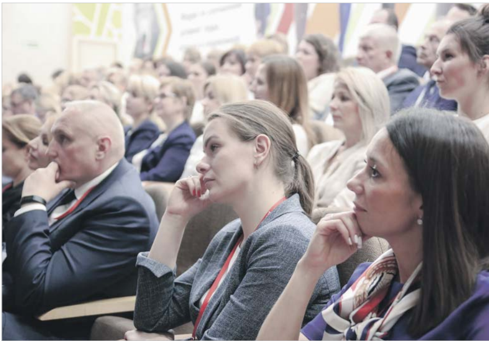
В форуме приняли участие сто женщин со всей сети

Изначально договаривались не обсуждать на форуме вопросы гендерного равенства, но не поговорить о профессиях, которые сейчас женщинам недоступны, было невозможно. Вопрос пересмотра перечня неженских профессий сейчас находится в поле зрения Минтруда, ОАО «РЖД», профсоюза. Анкумуляторщик, водитель дрезины и его помощник, помощник и машинист мотовоза, дизельпоезда, электропоезда, а также всех видов локомотивов, монтер пути, составитель поездов, осмотрщик-ремонтник вагонов, ряд других профессий были закрыты для прекрасного пола постановлением правительства РФ еще в 2000-м году.