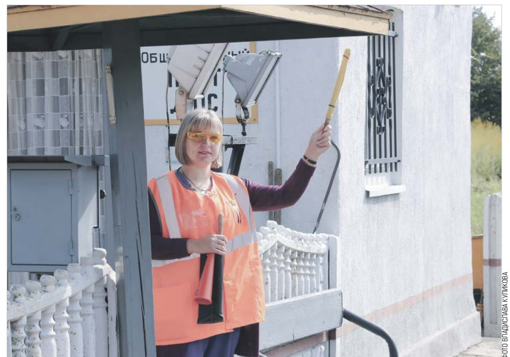
Дежурными по поезду в основном становятся представительницы прекрасного пола

И профсоюзу, и координационному совету есть над чем работать».