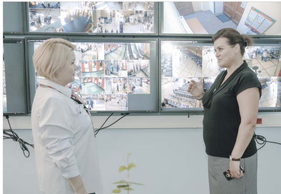
Более 30% работников РЖД сегодня — женщины

Ну а пока суд да дело, в компании приняты два серьезных кадровых решения — впервые главным инженером